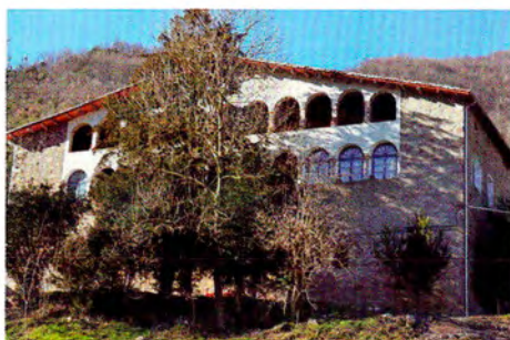
Reforma de tota la coberta sense la construcció de cercol i amb l'aprofitament de l'estructura.

Un altre sistema constructiu que s'associa de manera implícita a la intervenció d'una masia, i en concret amb la reforma de la coberta, és l'execució d'un cercol perimetral i la substitució íntegra de l'embigat de fusta. Cal analitzar prèviament l'edifici, l'estructura i en especial l'embigat de la coberta per conèixer si és necessari aplicar aquesta estratègia d'intervenció, ja que suposa un sobrecost a l'obra i en determinades situacions és del tot innecessari i fins i tot perjudicial atesa la rigidesa que s'imposa a l'edifici i que pot derivar en l'aparició de noves fissures o trencaments. Mai millor dit en aquest tipus de decisions tecnològiques, la frase de Mies van der Rohe que menys és més i, per tant, no per introduir nous elements constructius l'edifici funcionarà corporalment millor.