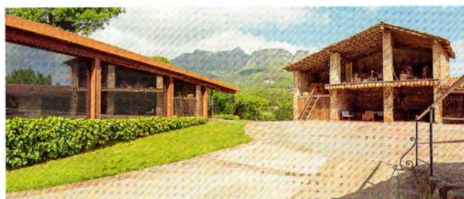
Adequació d'una quadra en un menjador destinat a turisme rural. Les Comes de Joanetes (Garrotxa).

L'extraordinària sensualitat es percep tant en els materials que han forjat aquesta arquitectura com als espais buits existents entre els edificis del mas. Aquesta disposició permet la percepció del paisatge circumdant al llarg dels itineraris exteriors de la propietat.