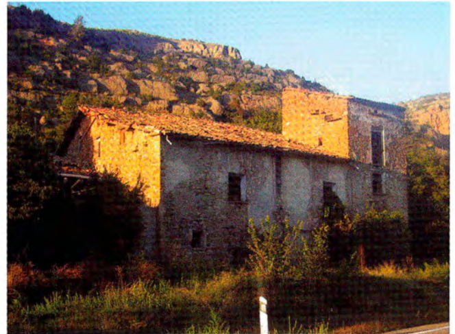
Masia deshabitada entre la Pobra de Segur i Sort. Pallars Jussà.

la colonització a l'interior dels edificis fins a arribar a diluir i a esborrar al cap de molts anys la seva existència.