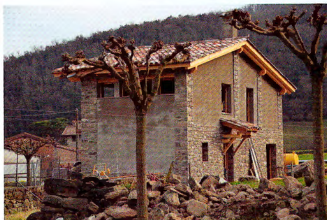
Conversió d'un porxo en habitatge. Exhibicionisme estructural.

Aquesta praxi provoca una important transgressió a aquest patrimoni, atès que esborra el llenguatge sublim que caracteritza tant aquesta arquitectura. És convenient interpretar-lo i adaptar-lo als nostres temps per donar resposta a les possibilitats actuals de confort en lloc de reproduir caligràficament el preexistent, fruit d'una època ja històrica. Quan l'edifici facilita una lectura clarament diferenciable respecte a les diverses èpoques de construcció mostra la seva temporalitat alhora que la masia pot respondre a uns espais habitables contemporanis òptims. L'arquitecte suís Peter Zumthor, premi Pritzker 2009, diu "la bona arquitectura ha d'acollir a l'home, deixar-li que visqui i habiti allà i no aclaparar-lo amb el seu discurs", la qual cosa reclama la qualitat de l'arquitectura des del silenci i la llibertat, i no des d'allò impropri i des de l'encorsetament.